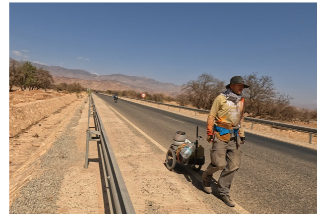
Mit dem Fahrradanhänger durch die Wüste: Bald wird Sascha die Westsahara durchqueren.

de Autofahrer ihren Daumen nach oben, um mich anzufeuern. Es kam auch schon vor, dass mir Lebensmittel gebracht wurden. Mir wurde auch schon ein Schlafplatz in einem Hotel spendiert. Eine warme Dusche ist nach einer Woche wirklich unfassbar erfrischend!